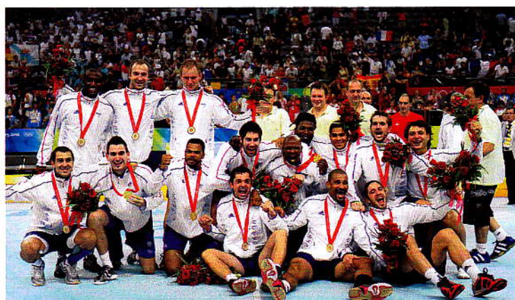
TITRÉS EN 2008, LES HANDBALLEURS FONT PARTIE DES 1 067 MÉDAILLÉS FRANÇAIS AUX JO.

Au terme de son travail, Benamou recense 819 médaillés français. Au terme du sien, Stéphane Gachet est nettement plus précis et exhaustif : ce n'est pas moins de 1 067 lauréats tricolores qu'il honore, dans